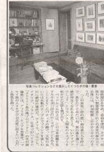
写真コレクションなどを展示したつくろい場。書庫。

文部省認可 プリンストン日本語学校 (週刊) 2003年度 幼・小・中・高 生徒募集