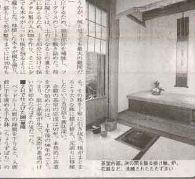
雪見窓から柔らかな日差し。