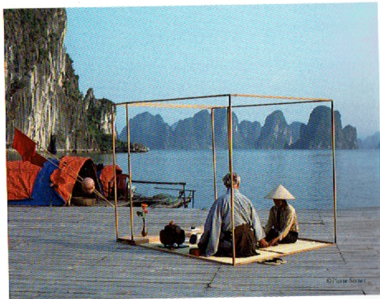
Dinh, Halong Bay, Vietnam, 2006.

With the cube being used as a conceptual space, Sernet invites viewers to place their own set of cultural, spiritual, religious or philosophical values within it. The purpose is to have audiences question the cube's opposition or similarities to the diverse environment in which it is placed and have viewers see each of these spaces in a new and different way, ultimately showing that these seemingly different and incompatible worlds are in fact based on similar universal values that can enable seemingly different worlds to cohabit together.